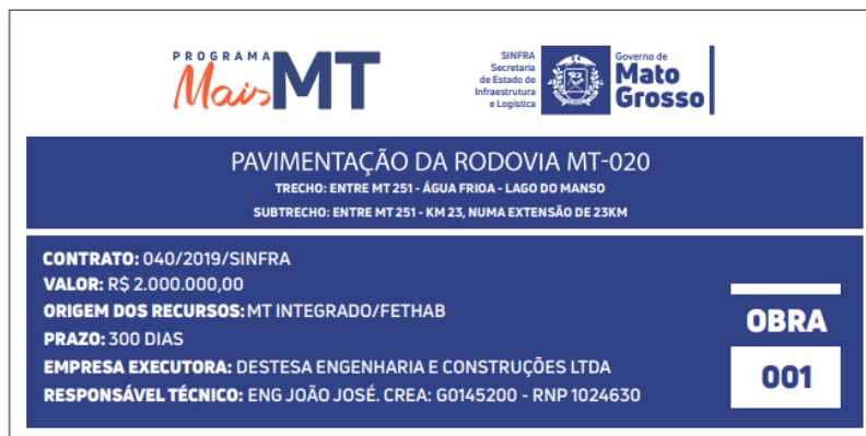
Figura 4 – Modelo de Placa de Obra.